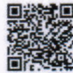
คู่มือและแนวปฏิบัติฯ

สำนักบูรณาการกิจการการศึกษา กลุ่มกิจการพิเศษ โทร/โทรสาร ๐ ๒๖๒๘ ๖๔๐๐