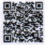
ประกาศกระทรวงฯ