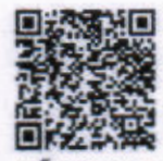
ทะเบียนกระทรวงฯ